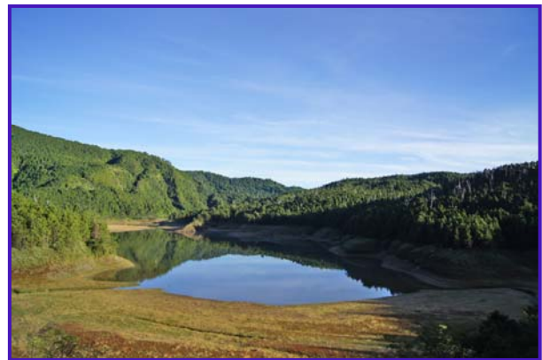
宜蘭太平山-翠峰湖