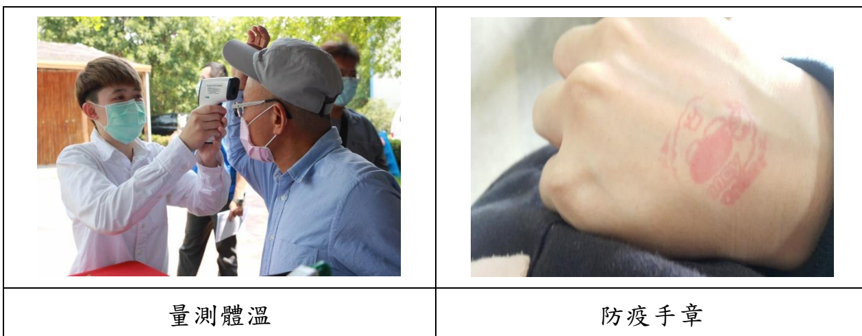
圖 5、體溫測量及手章識別意識圖