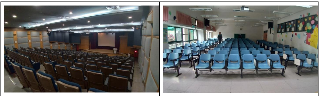
圖 1、國際會議廳 MA101 及階梯教室